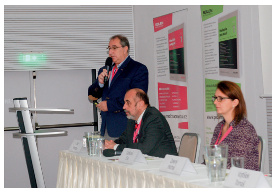
Přednášející závěrečného bloku Soudního lékařství