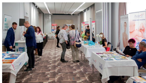
Výstava partnerů akce