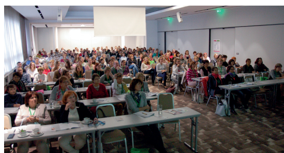
Pohled do zaplněného sálu při interaktivní přednášce