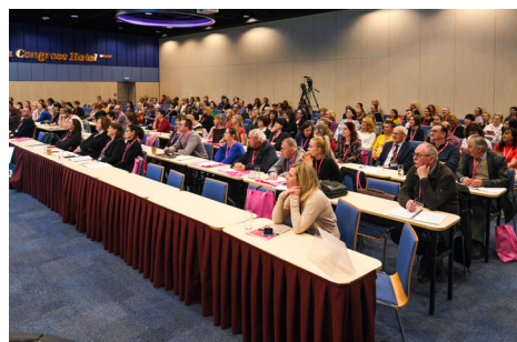
Letošní ročník olomouckého kongresu si nenechalo ujít téměř 290 lékařů .